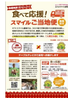
チャンネルガイド誌(月1回)にチラシを同封