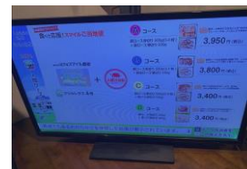
コミュニティチャンネルでプロモーション