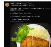
Twitterで活用方法を提案