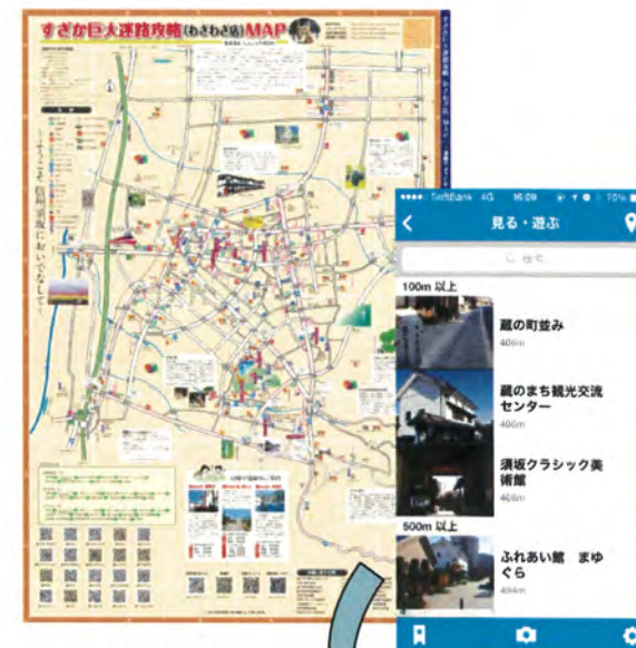
▲イメージ すざか巨大迷路MAP の電子化