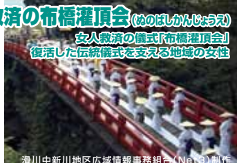
滑川中新川地区広域情報事務組合 (Net-Q) 制作

布橋灌頂会は、女人禁制のため立山登拝を許されなかった女性たちの極楽往生を願った儀式。明治時代の廃仏毀釈運動で途絶えましたが、平成8年に再現され5度目の開催。現代によみがえった癒しの儀式を紹介します。