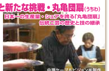
中讃ケーブルビジョン 株式会社制作

国内生産の約90%を占める丸亀団扇。材料は竹からプラスチックへ変わり、安価・大量生産が求められる昨今。丸亀の経済の一翼を担う産業、ふるさとの宝として伝統工芸の技を継承し、デザイン団扇など新たな価値の創造に取り組む様子を紹介しします。