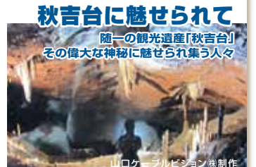
山口ケーブルビジョン 株式会社制作

広大な草原と石灰岩が特徴的なカルスト台地・秋吉台。地下には大小400以上の鍾乳洞が広がる秋芳洞。その神秘的なさまに魅了され、この地で活動をする人々を紹介しします。