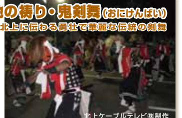
北上ケーブルテレビ 株式会社制作

祖父も舞った、父も舞った、孫の子も舞うであろう「鬼剣舞(おにげんばい)」。何も加えず、何も略さず伝承する。幸せを帯びる舞は、形だけでなく心の継承なくして観る者舞う者の魂を揺さぶらない。そんな鬼の宝を遺したい。