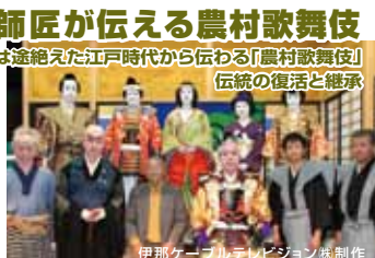
伊那ケーブルテレビジョン 株式会社制作

山の神を信仰していた山里に江戸時代、旅の一座が持ち込んだ歌舞伎。中尾歌舞伎として地元根付いていましたが、昭和の戦争で消滅。地域の若者が当時の役者「師匠」の指導で見事復活。保存会の活動を通じて「伝承される宝」に迫ります。