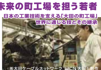
株式会社大田ケーブルネットワーク (JCN 大田) 制作

世界最高峰の技術を持つ町工場が集まる「モノづくりのまち・大田」。後継者不足が叫ばれる中、若者を積極的に採用し、技術の継承に取り組む町工場があります。究極の技と若い技術者(WAZABITO)達の今に密着します。