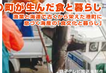
銚子テレビ放送 株式会社制作

漁業と海運で古くから栄えた港町、銚子。市場に出せなかった鮫を材料にした「蒲鉾、はんぺん」をはじめ、保存食である「海藻こんにやく」など、銚子には、海産の町ならではの食文化と暮らしが息づいています。