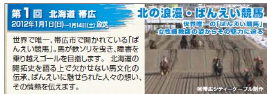
『けーぶるにつぼんーふるさとの宝ー』第1回放送番組