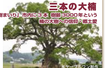
株式会社ケーブルワン制作

クスノキの大木が多い佐賀県でも、武雄には「樹齢3000年」と言われる大楠が3本あります。古くから大楠は、地域の人達の生活の身近にありました。地域でいかに大切に愛されてきたのか、大楠に集う人々と共に紹介します。