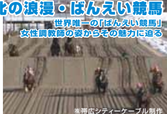
株式会社帯広シティーケーブル制作

世界で唯一、帯広市で開かれている「ばんえい競馬」。馬が鉄ソリを曳き、障害を乗り越えゴールを目指します。北海道の開拓史を語る上で欠かせない馬文化の伝承、ばんえいに魅せられた人々の想い、その情熱を伝えます。