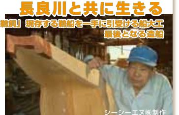
シーシーエヌ制作

日本三大清流長良川。長良川には多くの「歴史」「文化」そして「人」が関わる。全国的に有名な「鮫鮒」。鮫鮒に使われる川船を生産製造してきた船大工の最後の船造りに密着し、長良川の川文化を描きます。