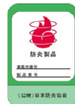
[防災製品ラベルの例]