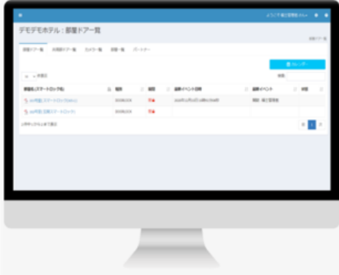
Connected Portal / 時限キー管理ツール (PC、スマホ、タブレット対応)

「Connected Portal」は、Connected Design が独自開発したIoT機器連携管理システムです。物件とそこに設置されたスマートロックやIPカメラ、その他センサーなどのIoT機器の登録・管理、およびスマートロックの時限鍵発行や各種機器の操作・状態確認を行うことができます。