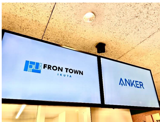
<IPカメラとデジタルサイネージ>