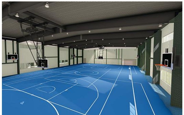
<体育館 室内イメージ>