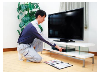
お客さま宅内工事

営業担当者から工事担当者への施工指示をシステム内で引き継ぐため、作業効率が向上し、施工時間の短縮化が図られ、お客さまのご負担が軽減されます。