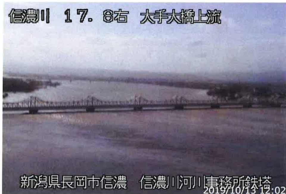
図2 映像情報の例 (カメラ設置地点：長岡市信濃 信濃川河川事務所鉄塔)