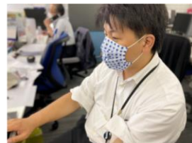
コムゾー*手ぬぐいで男性社員が、手づくりマスク