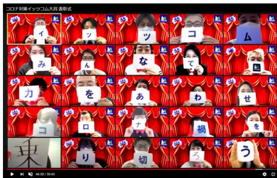
1文字ずつ掲げ、メッセージを作りました。 「イツコム みんなで 力をあわせ コロナ禍を 乗り切りよう」