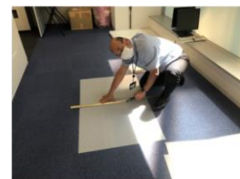
部長が、1週間で370席分パーティーを手づくり!!