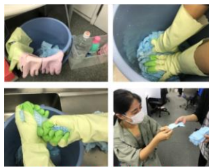
除菌ダスターを当番制で