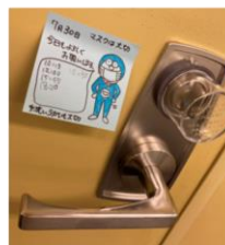
ドアノブ除菌を楽しくほっこりイラスト♪