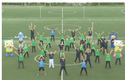
テレビを見ながら簡単にできる高齢者向けの体操(フロンタウンさぎぬまにて撮影)

自宅でテレビを見ながら簡単にできる体操で運動機能を向上するとともに、公園体操への参加促進（ソーシャルディスタンスなど感染対策を講じた上で開催）など、運動習慣の定着やご近所同士の交流による高齢者の健康づくりを応援します。