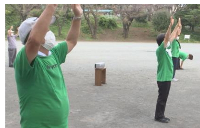
番組の最後には地域の公園体操を紹介