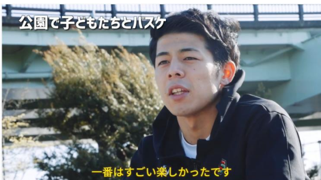
公園で子どもたちとバスケ