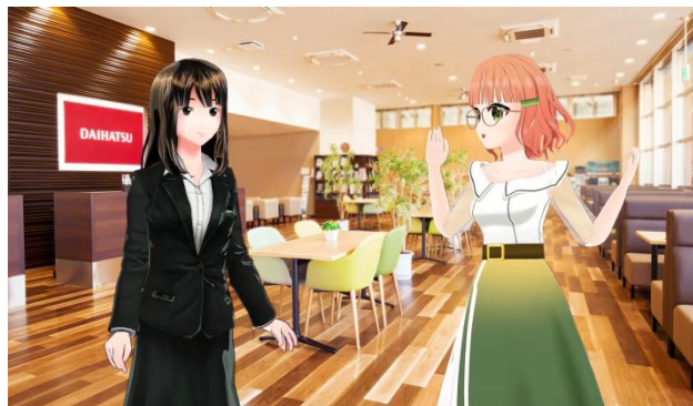
岐阜ダイハツウエルカムストアCM