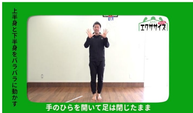
上半身と下半身をバラバラに動かす