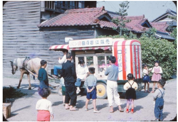
写真:昭和30年代の様子