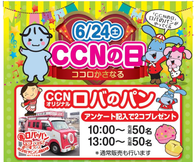
(写真:連携第一弾となるCCNの日のチラシ)