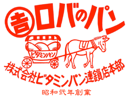
ロバのパン は登録商標です

* お二人は京都の本部 株式会社ビタミンパン連鎖店本部の 取締役も兼任されております。