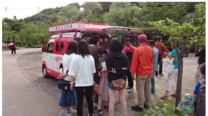
写真:今のロバのパン販売風景