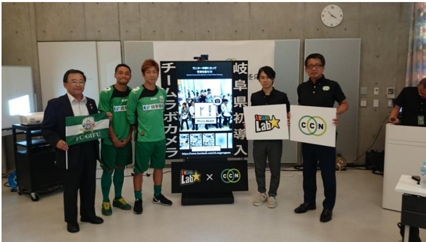
写真:6月16日「ぎふメディアコスモス」で行われた発表会