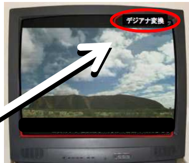
デジアナ変換視聴中の画面(例)

ご覧の放送がデジアナ変換されたものかどうかは、 画面右上の表示「 デジアナ変換 」でわかります。