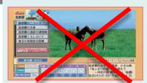
データ放送の画面例