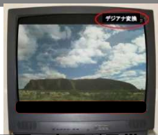
画面の上下が黒帯の例