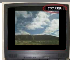
画面の上下左右が黒帯の例

機器の仕様により動作が異なる場合 がありますので、ご注意ください。 詳しくはお使いの機器の取扱説明書 などでご確認ください。