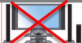
5. 1チャンネル機器を使っても サラウンドでは聴けません